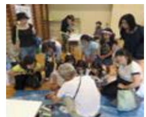
昨年度の写真 ねり丸号と乾電池工作